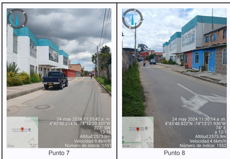
Ilustración 2. Fotos de los puntos del Recorrido de Control Y Vigilancia.